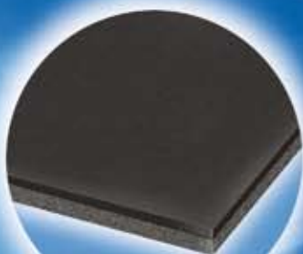
ST GK 072